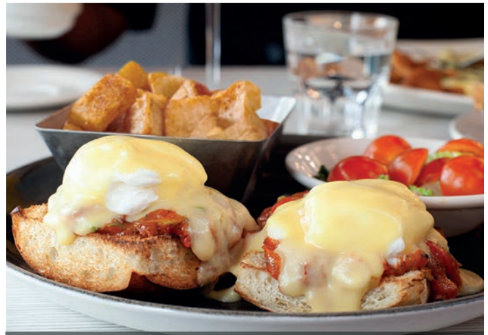
Œufs bénédicines all'italiana