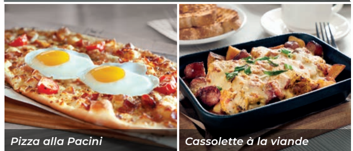
Pizza alla Pacini