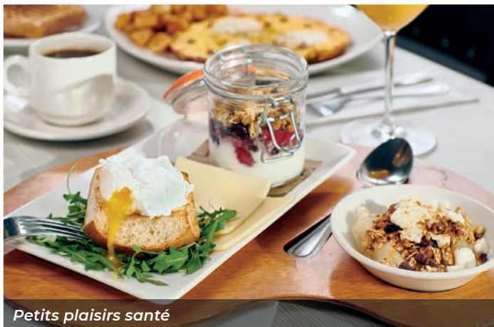
Petits plaisirs santé