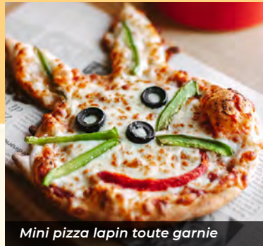
Mini pizza lapin toute garnie