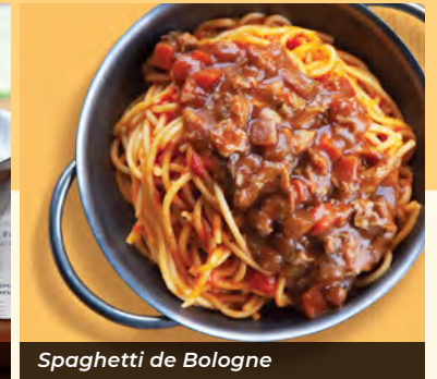
Spaghetti de Bologne