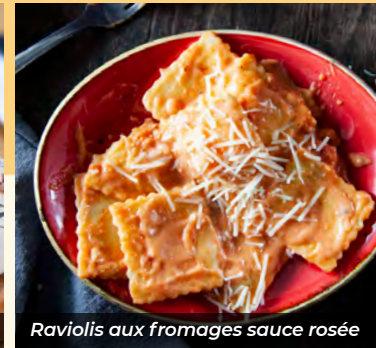
Raviolis aux fromages sauce rosée