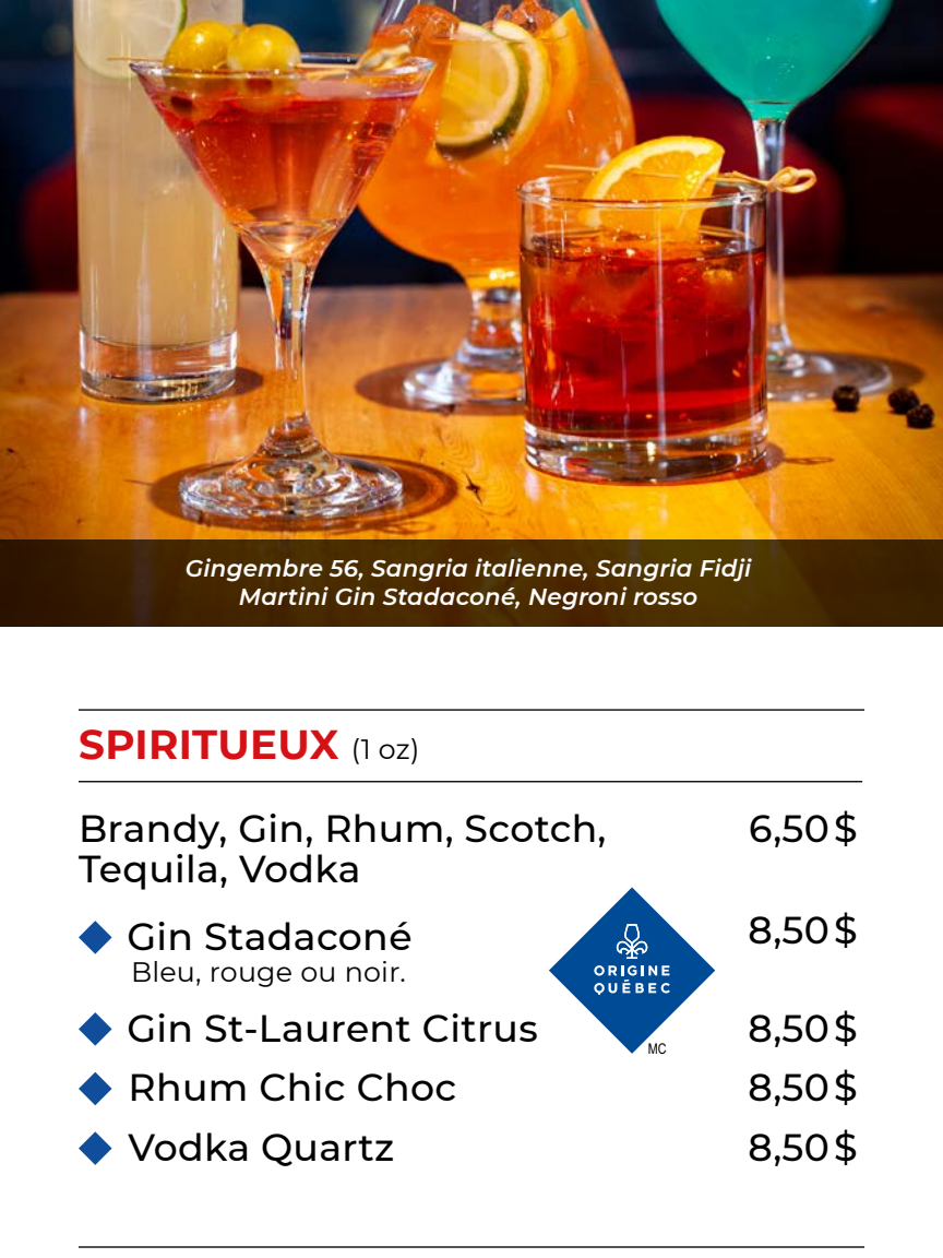
Gingembre 56, Sangria italienne, Sangria Fidji Martini Gin Stadaconé, Negroni rosso