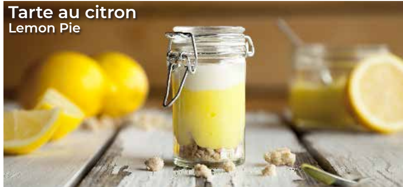
Tarte au citron Lemon Pie