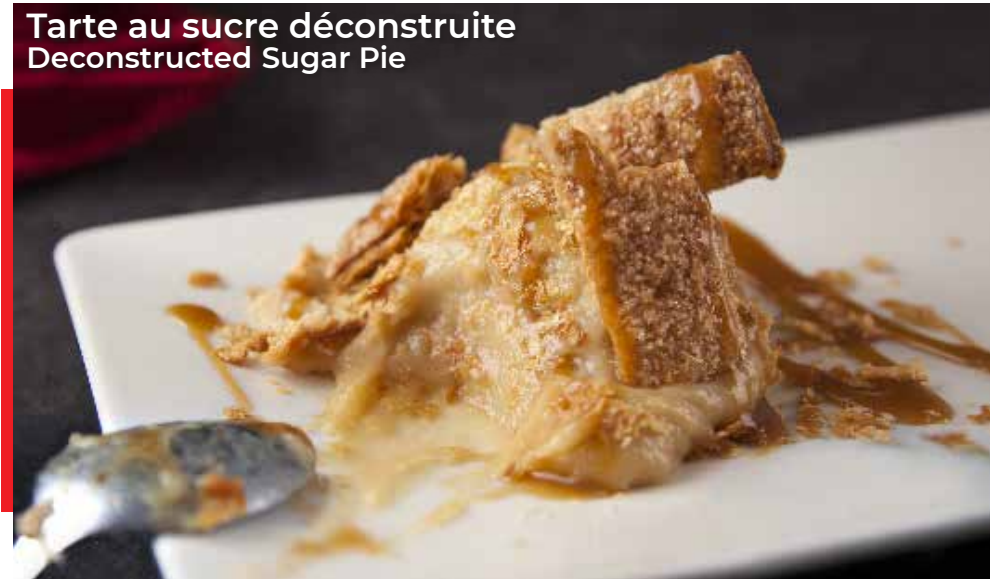
Tarte au sucre déconstruite Deconstructed Sugar Pie