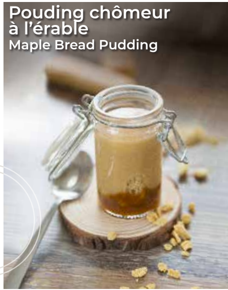
Pouding chômeur à l'érable Maple Bread Pudding