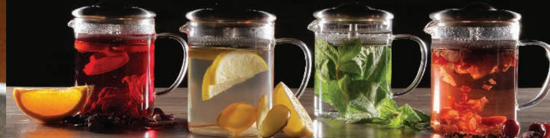
Lumière d'hibiscus Hibiscus Glow