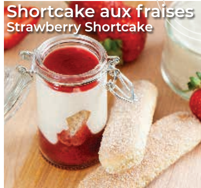
Shortcake aux fraises Strawberry Shortcake