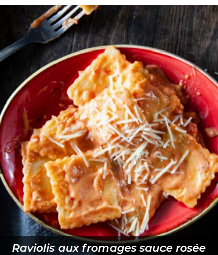
Raviolis aux fromages sauce rosée