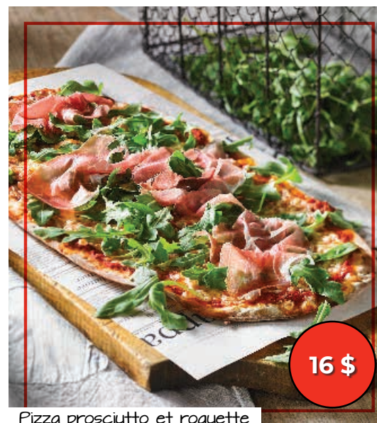
Pizza prosciutto et roquette