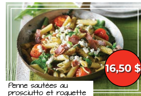
Penne sautées au prosciutto et roquette