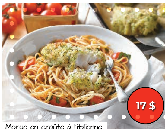
Morue en croûte à l'italienne