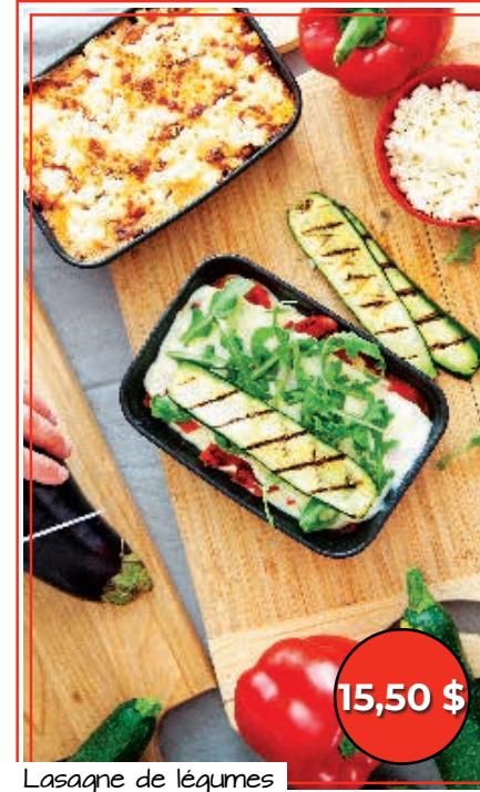
Lasagne de légumes