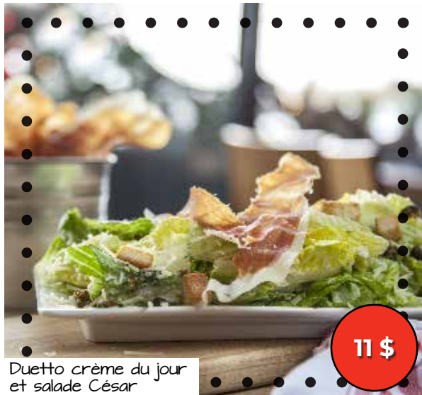
Duetto crème du jour et salade César