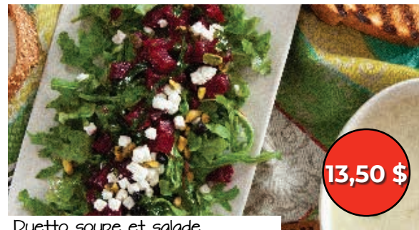
Duetto soupe et salade betteraves et chèvre