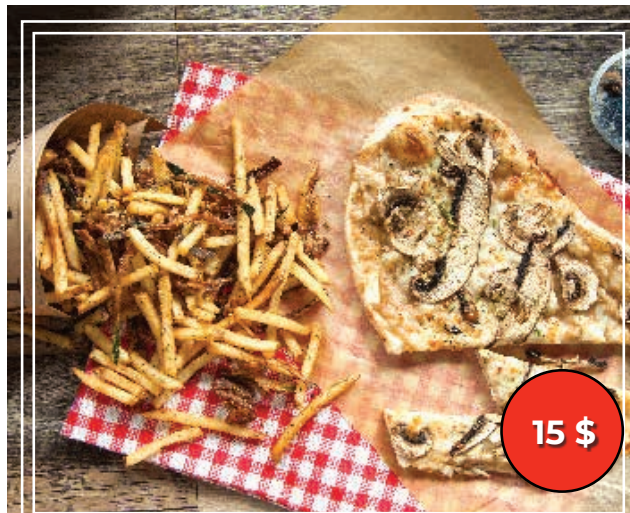
Duetto pizza champignons et truffe et frites parmigiana