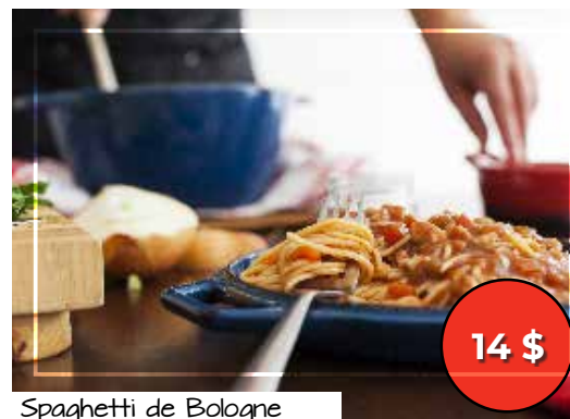
Spaghetti de Bologne