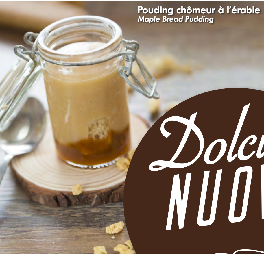
Pouding chômeur à l'érable Maple Bread Pudding