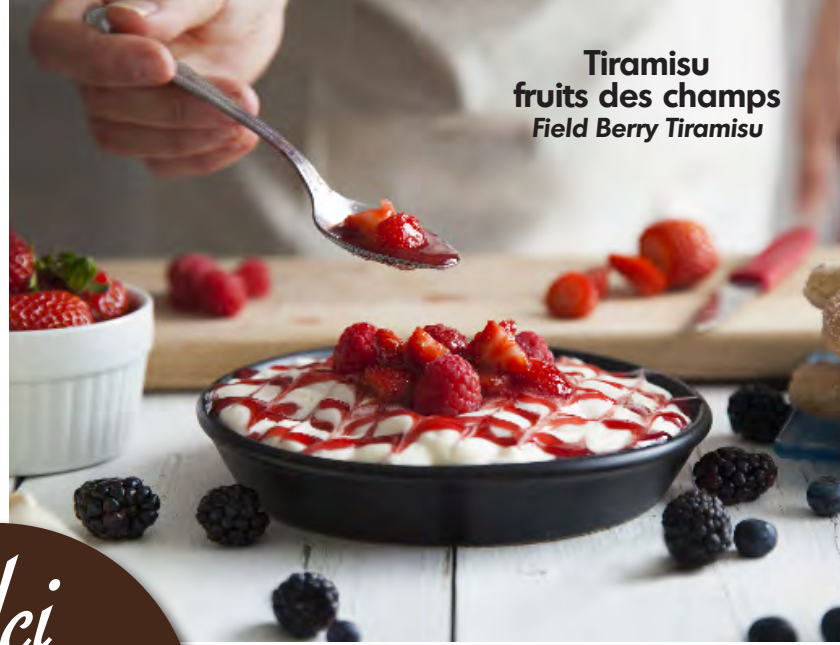
Tiramisu fruits des champs Field Berry Tiramisu