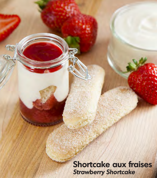
Shortcake aux fraises Strawberry Shortcake