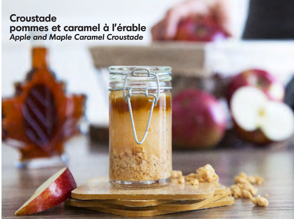
Croustade pommes et caramel à l'érable Apple and Maple Caramel Croustade