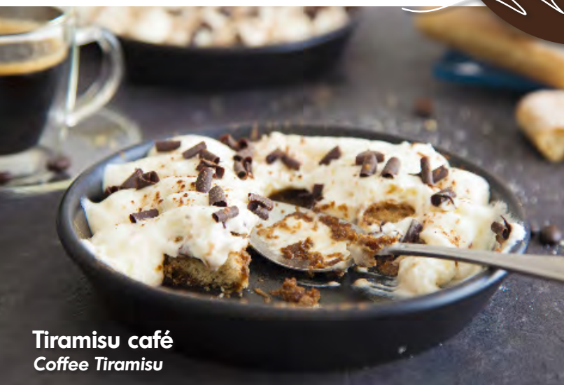
Tiramisu café Coffee Tiramisu