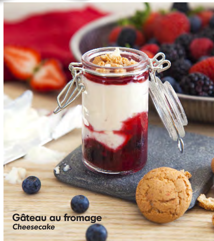
Gâteau au fromage Cheesecake